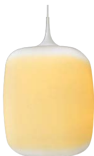
APE 510 349+AEE 590 166