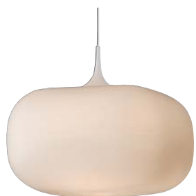
APE 510 347