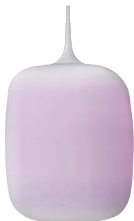
APE 510 349+AEE 590 162