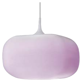
APE 510 347+AEE 590 161