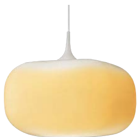
APE 510 347+AEE 590 165