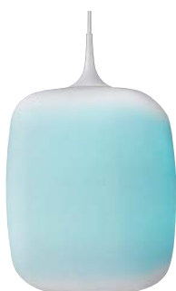
APE 510 349+AEE 590 164