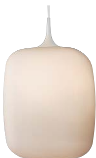
APE 510 349