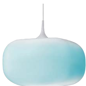
APE 510 347+AEE 590 163